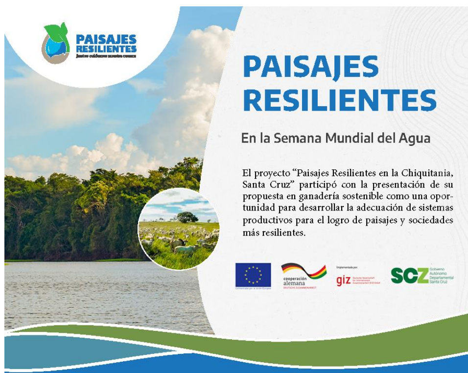
Ilustración 1. Paisajes Resilientes en la Semana Mundial del Agua.

La semana mundial del agua ( World Water Week ) por segundo año consecutivo fue celebrada de manera virtual mediante una serie de eventos en los que participaron alrededor de 16.200 personas y representantes de distintas organizaciones públicas y privadas provenientes de 170 países.